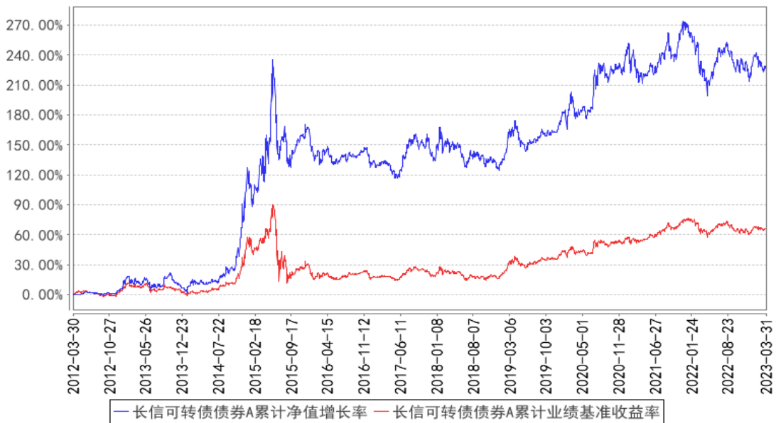
长信可转债债券A累计净值增长率与同期业绩比较基准收益率的历史走势对比图

自合同生效之日（2012年3月30日）至2023年3月31日期间，本基金份额累计净值增长率与同期业绩比较基准收益率历史走势对比：