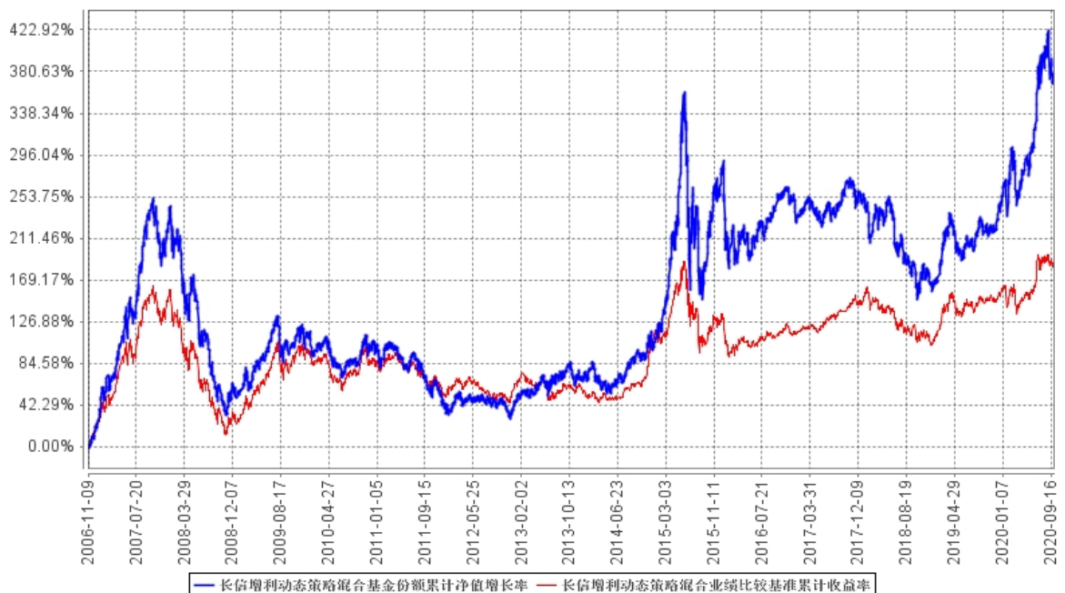
长信增利动态策略混合基金份额累计净值增长率与同期业绩比较基准收益率的历史走势对比图

自合同生效之日（2006年11月9日）至2020年9月30日期间，本基金份额累计净值增长率与同期业绩比较基准收益率历史走势对比：