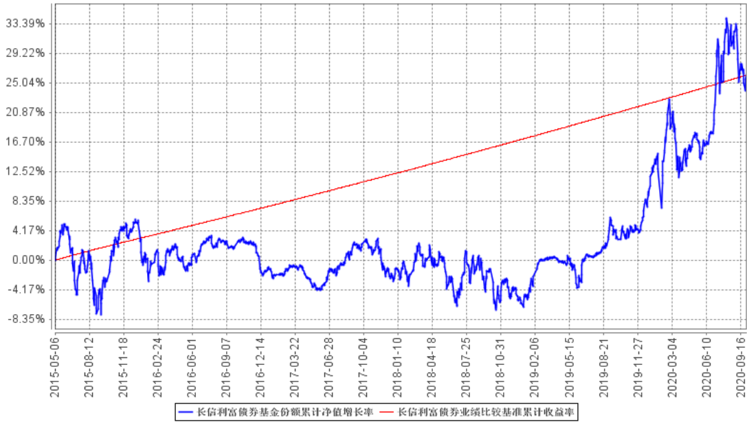
长信利富债券基金份额累计净值增长率与同期业绩比较基准收益率的历史走势对比图